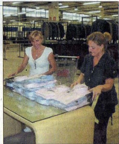
L'allestimento del Temporary shop all'interno dell'ex Mercatone, chiuso da un anno e mezzo per la grave crisi del centro commerciale

po Ascoli -. Il temporary shop andrà avanti dal 18 settembre tutti i giorni con orario continuato dalle 9 alle 21 fino al termine di ottobre. La speranza è quella di ottenere una proroga