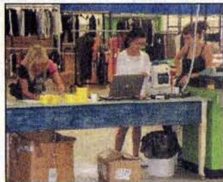
Il ritorno al lavoro